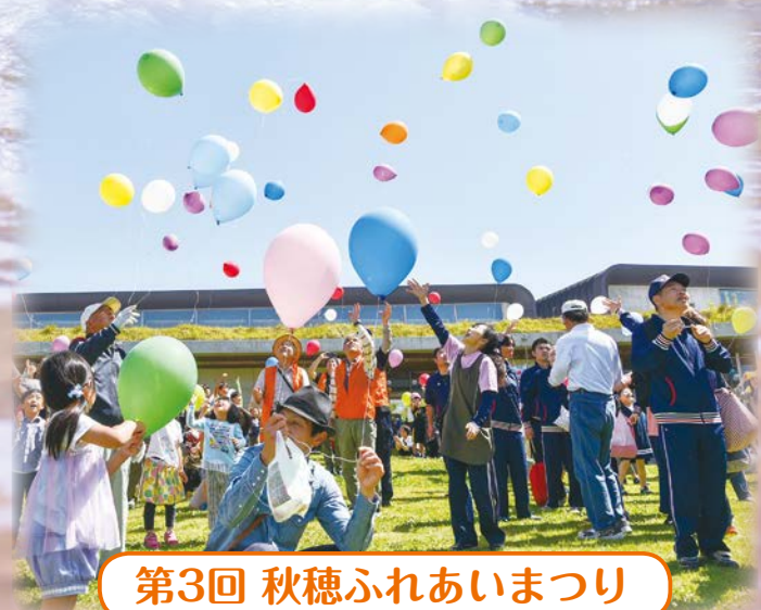
第3回 秋穂ふれあいまつり