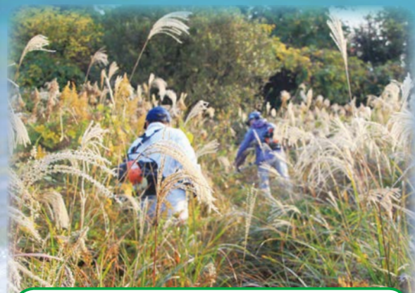
草山崎灯台広場環境美化活動