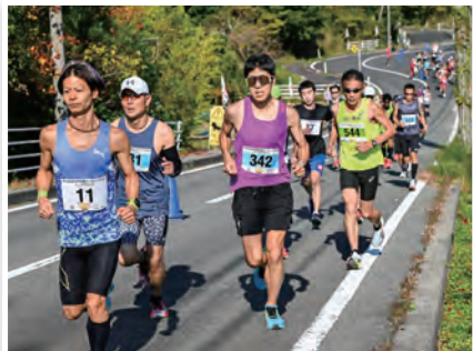
きつい坂もなんのその