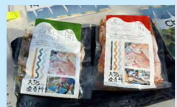
冷凍商品なので、日持ちします。

秋穂の皆様には、温かく迎えていただき、心より感謝申し上げます。 今では地元より居心地の良い秋穂に、協力隊卒業後も住まわせていただくことになりました。 デザインやインスタ運用のサポートなどのお仕事も請け負い、秋穂の産業の力になれたらうれしいなと思っています。 今後どうぞよろしくお願いいたします！