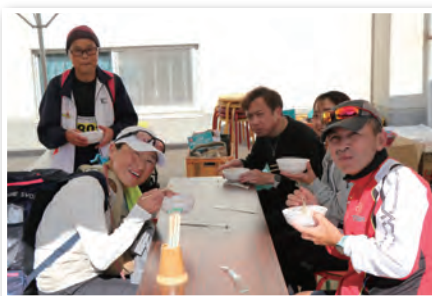
食推さんの豚汁おいしい～