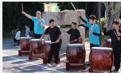
秋穂太鼓で応援しました