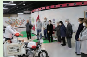
交通安全意識が高くなりました

飲酒運転ゴーグル体 験や事故体験シミュ レーターを使ったさま ざま体験をし、改めて 安全運転の大切さを学 びました。