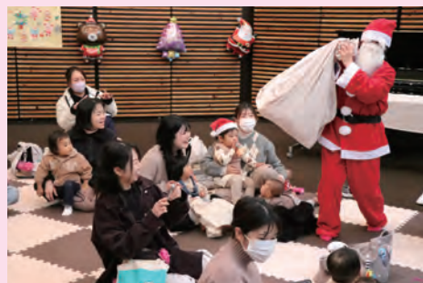
楽しいおはなし会でした

ボランティアの方にお手伝いいただき、パネルシアターや絵本の読み聞かせ、紙芝居などをして、みんなで楽しい時間を過ごしました。その後、子どもはサンタさんからお菓子、ママさん達もプレゼントをもらい、みんな大喜びでした。