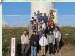
とてもきれいになりました

12月7日(日)、23人の 協議会運営委員で草刈を しました。きれいになっ た灯台広場から雄大な大 海原を、ぜひご覧ください。