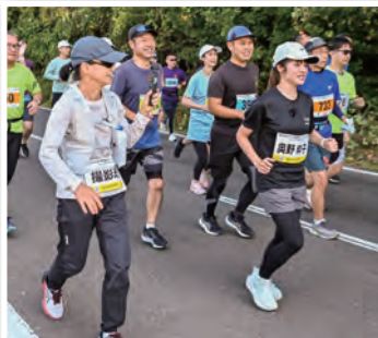
tys奥野粹子アナウンサーも参戦！