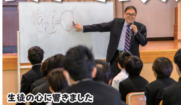
生徒の心に響きました