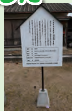
八坂神社・石宝殿の看板

市宝藤左衛門の祖、市宝庄左衛門は、慶長9年(1604年)6月に毛利輝元が萩の指月城を築 くときに大阪から迎えた石工。藤左衛門が刻した石造物は正八幡宮前石狛犬、正八幡宮由来碑、 一の鳥居など数多くある。