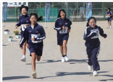
ファンランを楽しみました