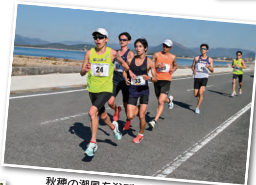
秋穂の潮風を浴びて走りました