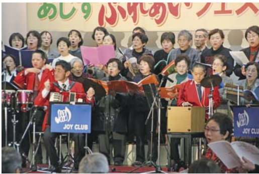
エンジョイしました