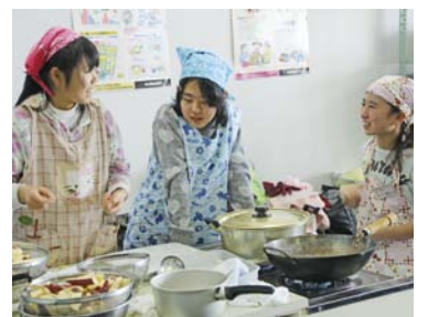
楽しく料理しました

来年度も小学4年生から6年生までを対象に募集をする予定にしています。違う学年の人と一緒に料理作りをしてみたい人はぜひ申し込んでくださいね!(4月に募集します)