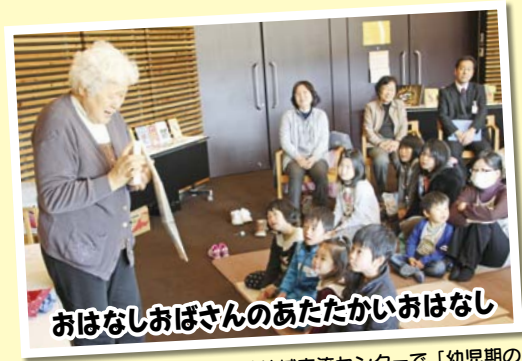
おはなしお婆さんのあたたかいおはなし

2月8日(土)、秋穂地域交流センターで、秋穂にここくクラブの主催による「子どもの居場所づくり事業～ゆびあみしよう!」がありました。参加した20人の子どもたちは、指を使って毛糸を編んでいき、マフラーを作りました。まさに「手づくり」の作品ができあがり、子どもたちの喜びも大きかった様子でした。