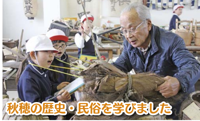
秋穂の歴史・民俗を学びました

1月28日(火)、秋穂小学校3年生が、社会の授業の一環で、秋穂歴史民俗資料館を見学に行きました。子どもたちは、実際に民具を見てさわって、伝承グループの皆さんの説明を聞き、興味津々の様子でした。