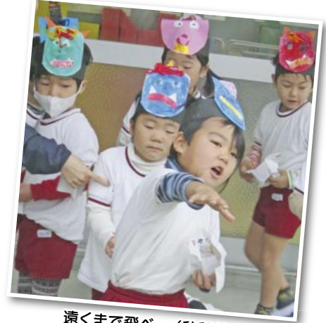
遠くまで飛べ〜 (秋穂幼稚園)