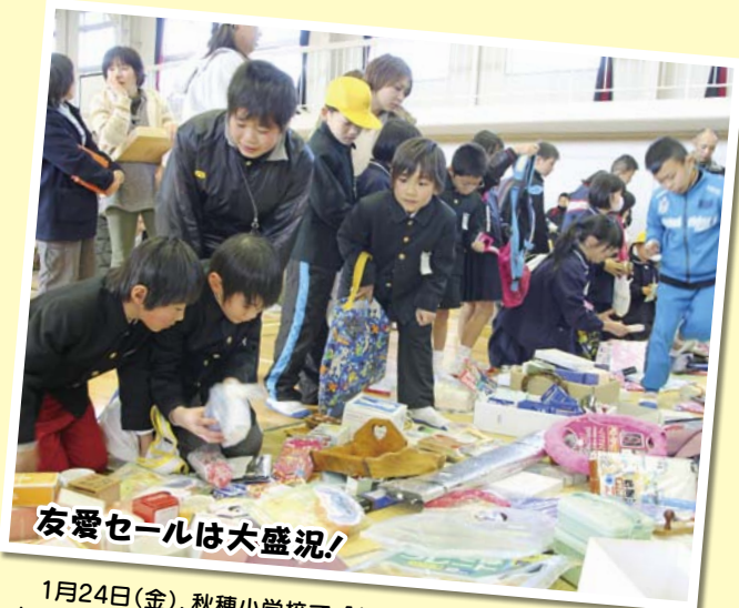
友愛セールは大盛況!

2月6日(木)、大海小学校で、「昔遊び交流会」がありました。1・2年生42人の子どもたちは、秋穂伝承グループの皆さんの指導で、コマ、あやとり、紙飛行機、竹馬、お手玉など、様々な昔の遊びを体験しました。