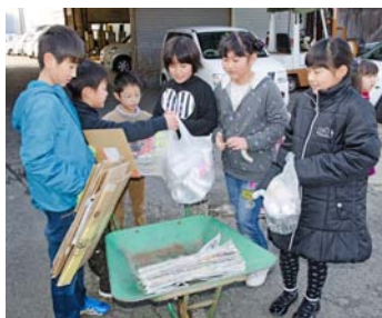
みんなで協力しました

した。身近な話題を取り上げた地域情報紙からの発信に、地域の皆さんからの情報提供が添える双方向性と、皆さんの笑顔がいったいな紙面づくりが評価され受賞に至りました。今後も「あいお愛」にあふれる紙面づくりに、積極的にご参加ください。