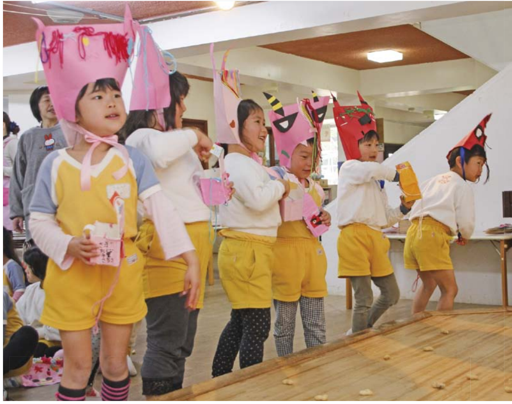
力をあわせて鬼退治 (秋穂保育園)