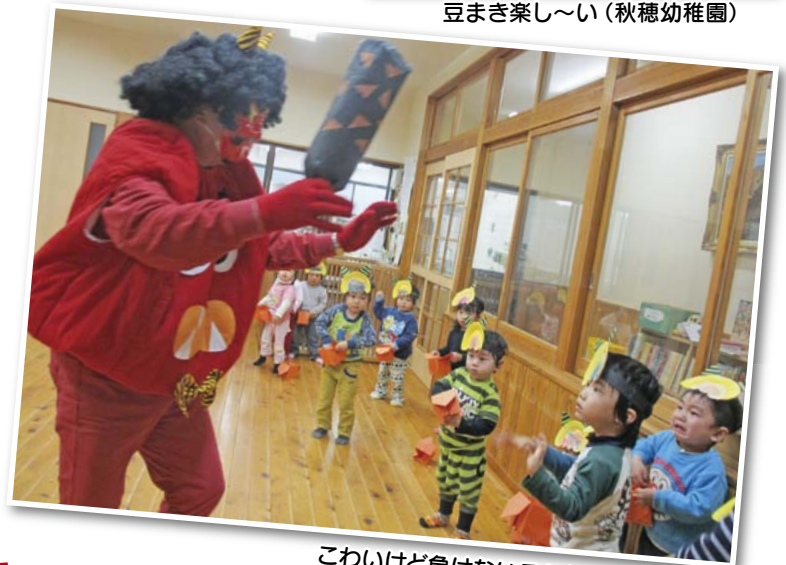
こわいけど負けないぞ! (大海保育園)