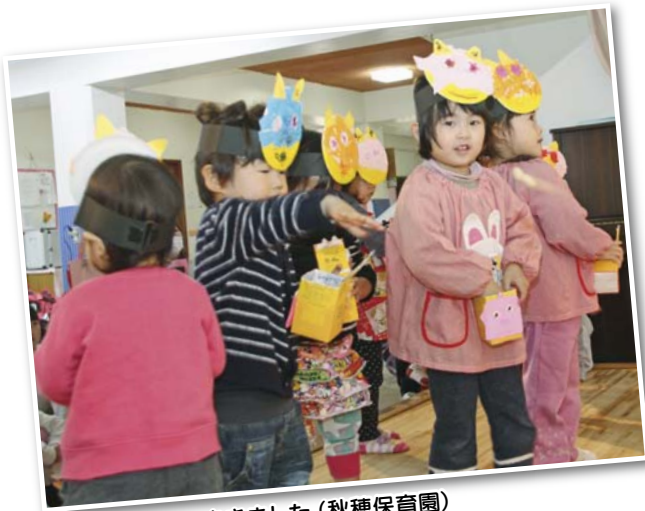
元気いっぱいまきました (秋穂保育園)