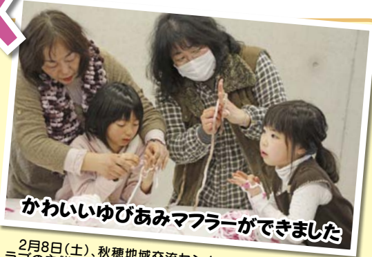
かわいいゆびあみマフラーができました

1月24日(金)、秋穂小学校で、「友愛セール」がありました。「友愛セール」は、その収益金がヘルメットや学校備品購入など、子どもたちのために役立てられています。今年も多くの友愛品が集まり、会場には多くのかたが来場され、激安の品々をたくさん買われていました。