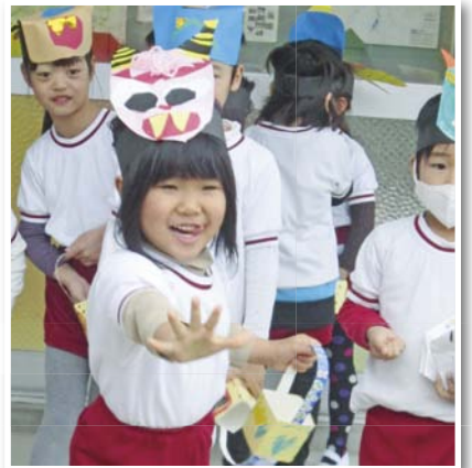
豆まき楽し〜い (秋穂幼稚園)