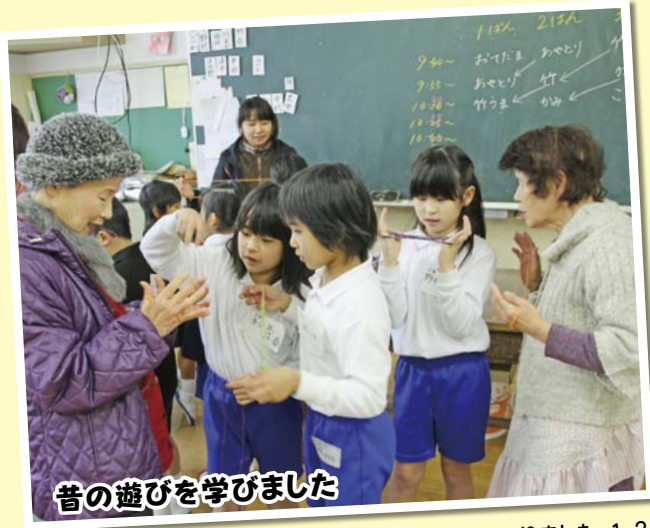
昔の遊びを学びました

2月6日(木)、大海小学校で、「昔遊び交流会」がありました。1・2年生42人の子どもたちは、秋穂伝承グループの皆さんの指導で、コマ、あやとり、紙飛行機、竹馬、お手玉など、様々な昔の遊びを体験しました。