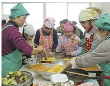
食推さんのやさしい指導で