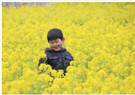
きれいに咲きました♪