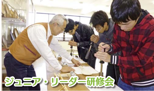
ジュニア・リーダー研修会

3月15日(土)、秋穂ジュニア・リーダーズクラブが宮島研修へ行きました。宮島では、しゃもじづくり体験、厳島神社参拝、宝物館見学をしました。宮島の歴史や自然、文化に触れながら、リーダーとしての知識・経験を深めることができました。