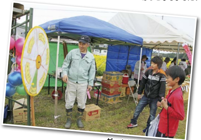
ゲームを楽しみました♪