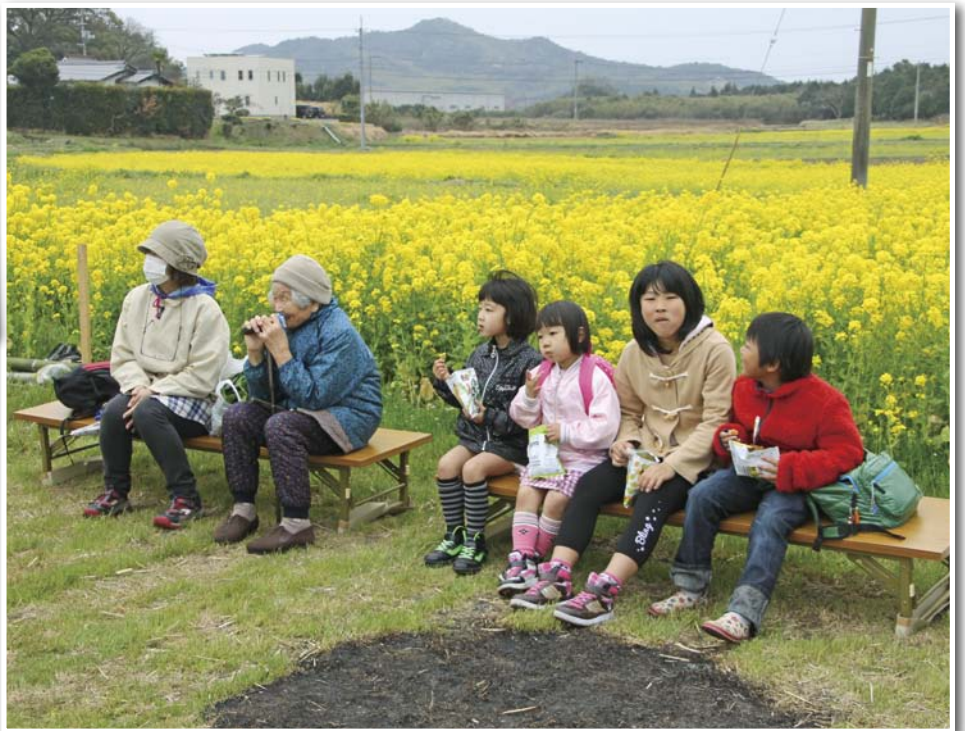
ほっこりしました♪