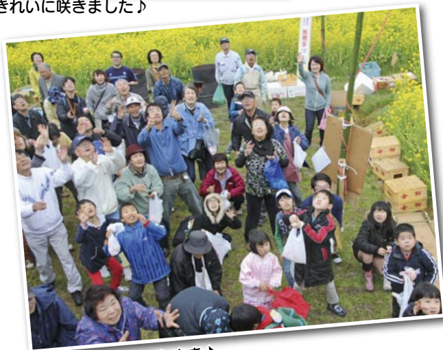
フィナーレはもちまき♪